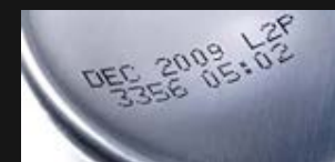
Impresión de Lote y Fecha