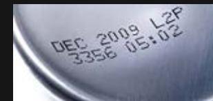
Impresión de Lote y Fecha

Imprime hasta 4 líneas de texto, códigos de barras, códigos 2D y logotipos a velocidades de hasta 120 metros/minuto con una resolución de 600DPI, además dispone de conector USB, para permitir la transferencia de mensajes entre