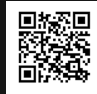
Impresión de Códigos 2D